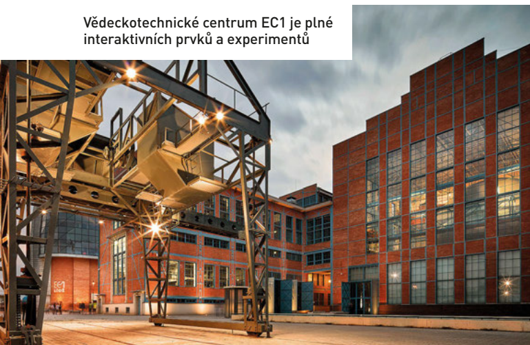
Vědeckotechnické centrum EC1 je plné interaktivních prvků a experimentů

Je jedno, jestli máte malé nebo velké děti, jakmile před nimi zmíníte slova „zábavní centrum“, nezbavíte se jich, dokud je do nějakého nevezmete. My u Lodži navštívili rovnou dvě a pokud byste měli čas, rozhodně doporučujeme navštívit obě. ➤