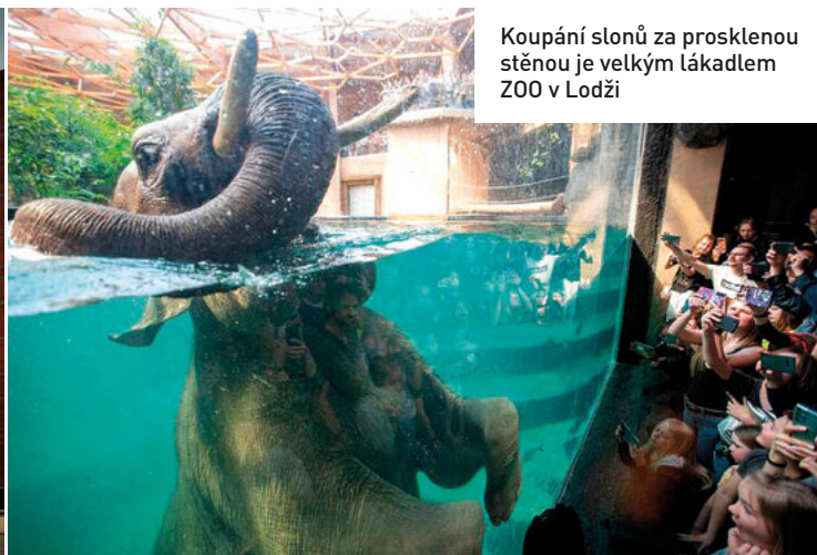
Koupání slonů za prosklenou stěnou je velkým lákadlem ZOO v Lodži