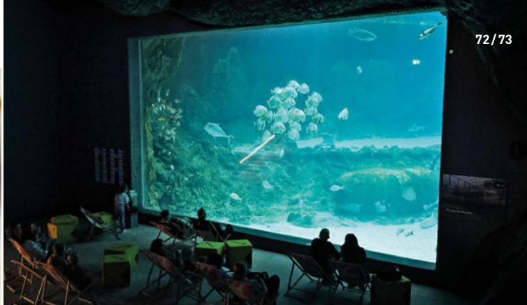
Nad hlavami v Podmořském tunelu v Orientariu ZOO vám plavou žraloci, želvy i rejnoci