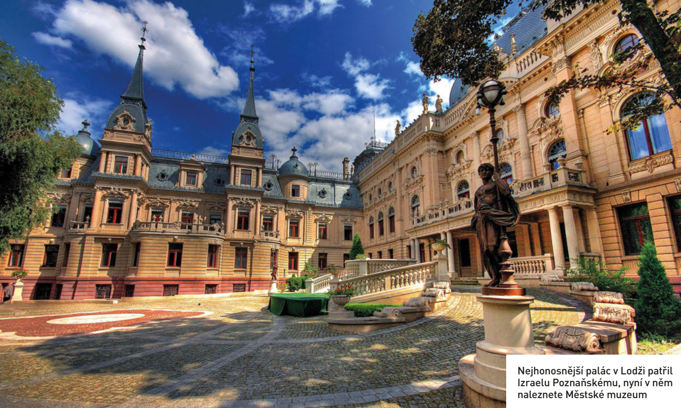
Nejhonosnější palác v Lodži patřil Izraelu Poznaňskému, nyní v něm naleznete Městské muzeum