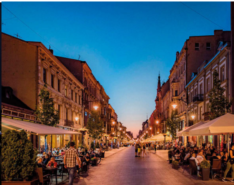
Piotrkowska ulice měří 4,5 kilometru a je nejdelší pěší zónou v Polsku

budou bolet nohy, můžete se nechat svést na místní rikši nebo zajít do restaurace Cud Miód na nejlepší pizzu ve městě.