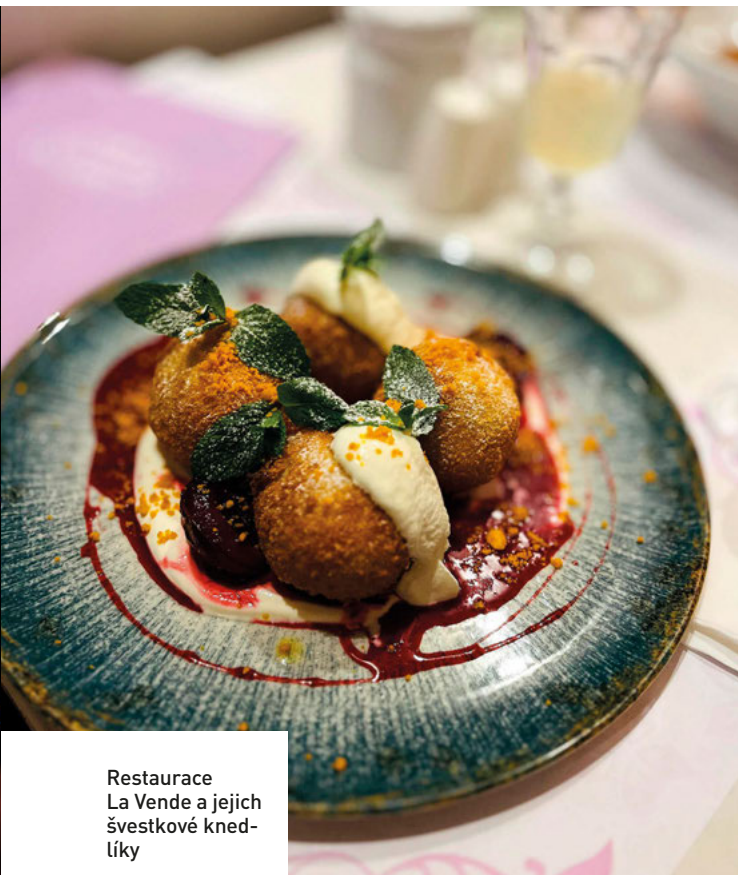
Restaurace La Vende a jejich švestkové knedlíky