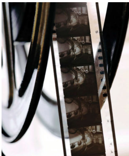
Muzeum filmu vás seznámí s historií kinematografie

Stejně populární je Piotrkowska ulice. Také ona se pyšní jedním „nej“. Se svými 4,5 kilometry je to nejdelší pěší zóna v Polsku. Po celé délce je rozseto velké množství butiků, obchůdků, hospůdek a klubů. Žije to tu po celý den, ale nejvíce si ji užijete v podvečerních hodinách, kdy je tu velmi rušno. Ulicemi se nese smích lidí sedících na zahrádkách a osvětlené výlohy jí dodávají jedinečné kouzlo. Až vás