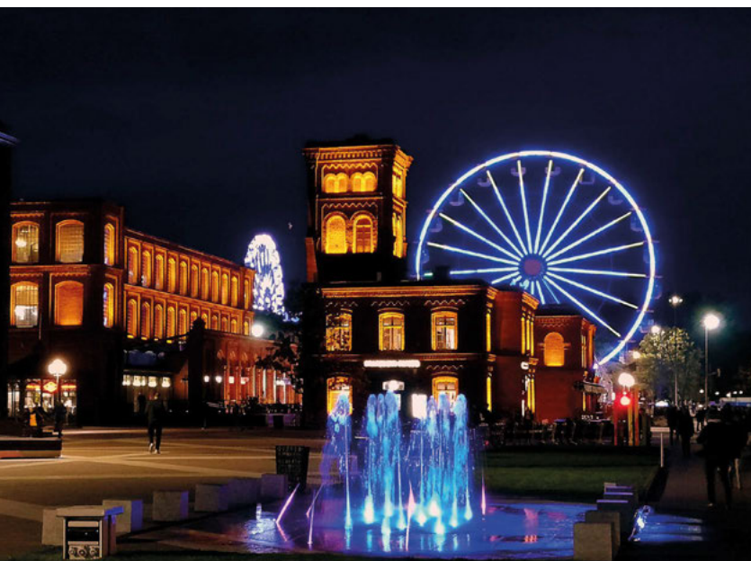
Manufaktura je největší obchodní a kulturní centrum v Polsku