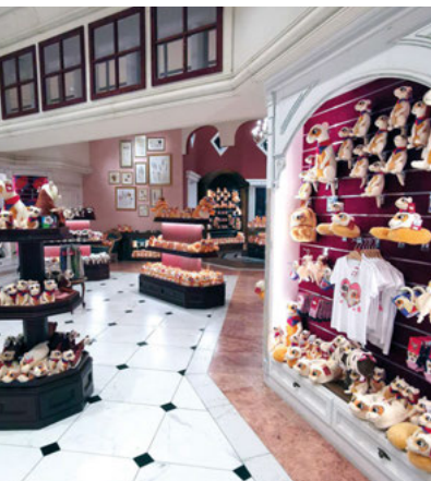
Mandoria nám svými atrakcemi a prostředím připomínala Disneyland

Správná polská výslovnost města Lodž je „wudź“ a tak by vás asi ani nemělo překvapit, že místí obyvatelé svému městu říkají „Hollywudź“. Jak výstižné, co říkáte? ◀